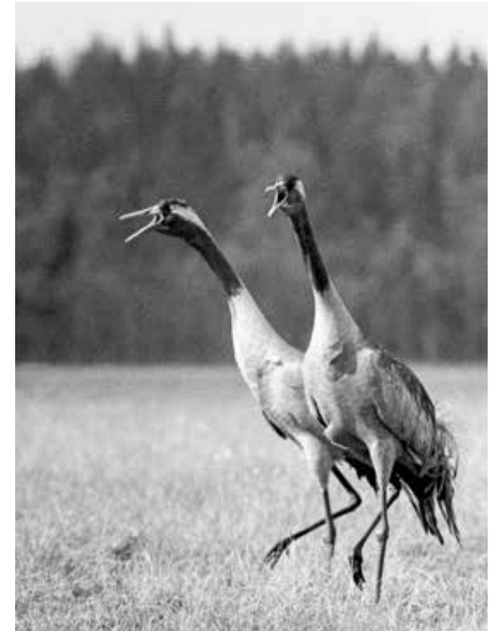
Kurkiparin huuto suolla 1963.

Ensimmäisen kirjan henkinen merkitys oli Hannu Hautalalle suuri, etenkin kun se sai melko hyvät arvostelut. Se kulki aina hänen mukanaan ”rättärissä”, ja hän ylpeänä esitteli sen avulla kuvaushommiaan. Hannu Hautalan isä kuoli pari