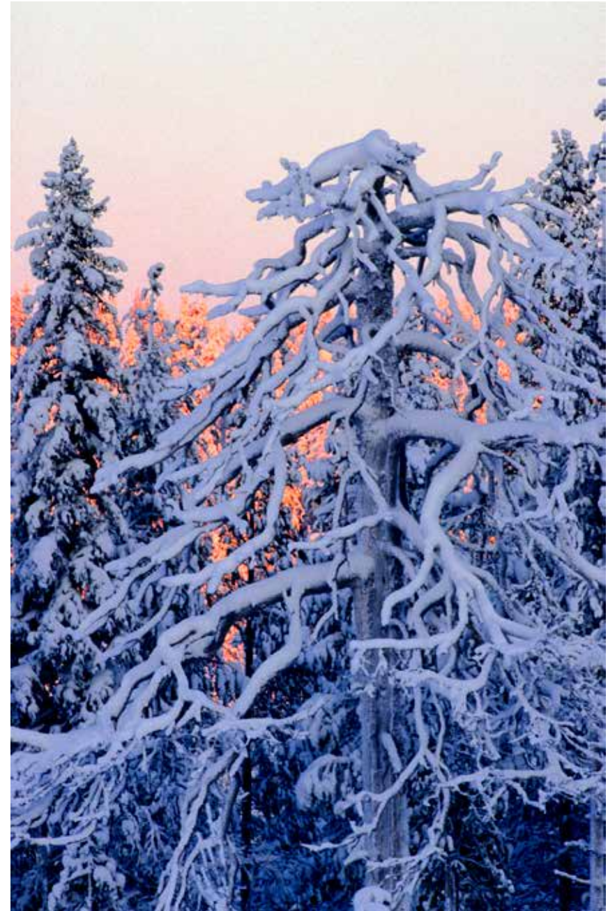
Taigametsän talvi” -kirjan (1990) kansikuva kuvattuna talvisena päivänä Kuusamon Laihavaarassa.

Kirjassa on myös 14 millimetrin erittäin laajakulmaisella objektiivilla kuvattuja maisemia, mikä ei ollut Hautalan mukaan tuolloin kovin yleistä. Kuvat oli otettu juuri oikealla hetkellä lyhyen talvipäivän sarastaessa tai iltaruskon