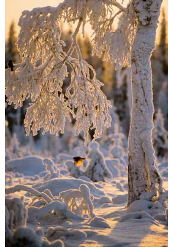
Kuukkelipari kylmän talvipäivän valossa. Helmikuu 1987.

Kuukkelin maa -kirjan kuvat kertovat vuodenkierrosta Kuusamon luonnossa. Nimenomaan kuvat, sillä aikakauden valtavirrasta poiketen teos on kuvakirja, jossa ei ole artikkeliosaa vaan ainoastaan Hautalalle tyypilliset melko pitkät kuvatekstit. Muutamat kirjan kuvista ovat nyt klassikkoja: koskikara jäisellä oksalla hyisen virran yllä, uivelopari jäisellä liekopuulla, jänis kuulolla portin edessä. Kirjassa on myös kuvia kasviharvinaisuuksista tikankontista, neidonkengästä ja lapinvuokosta sekä maisemista talven niukassa valossa. Kuukkelin maa oli sekä arvostelu- että myyntimenestys. Se nimettiin vuoden 1984 luontokirjaksi. Sitä painettiin suomen, ruotsin, englannin, ranskan ja saksan kielillä. Yhteensä 32 000 kappaletta.